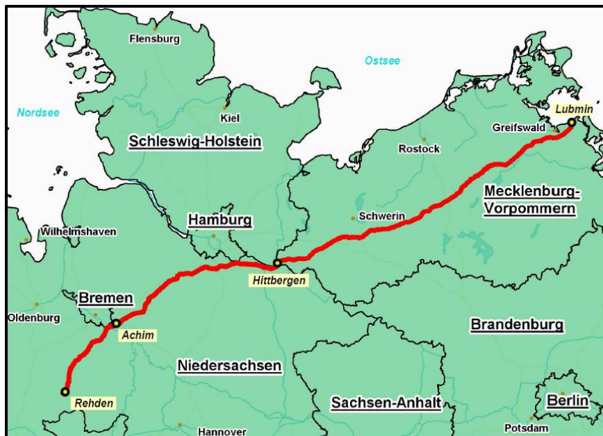
Abbildung 1: Trassenverlauf der NEL

Energieprojekten gezählt wird. Die nach der Kernkraftwerkskatastrophe in Japan beschlossene Energiewende in Deutschland verstärkt die Bedeutung solcher Erdgastransportpipelines für die Sicherung der deutschen Energieversorgung noch zusätzlich.